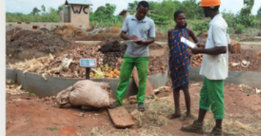
Le compost est fabriqué à partir des fruits et légumes avariés, fentes de volailles et autres déchets organiques ménagers.

Enfin, vous vous êtes installé à Tofo, au Bénin... ? M. G. : Oui, parmi les pays cibles, notre choix s'est porté sur le Bénin. Je me rappelle ma première visite dans ce pays, à Djigbé, une réserve naturelle de la commune de Tofo. Je me suis retrouvé au milieu du marché de Houégbo. Un lieu plein de vie et d'activité. Après 300 mètres, j'ai vu un dépôt sauvage en plein milieu de ce marché. Là où tout le monde voyait un problème, j'y ai vu une opportunité. Nous étions encore dans la phase de réflexion de notre projet de recyclage. Deux ans après,